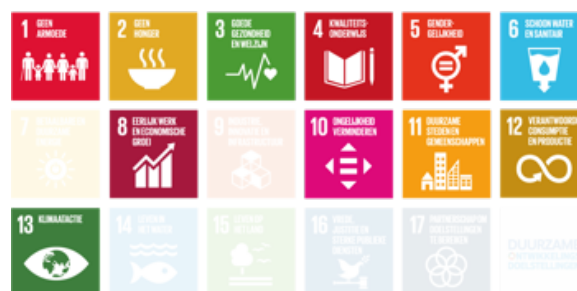
SDG's waaraan materiële thema's 2022 bijdragen