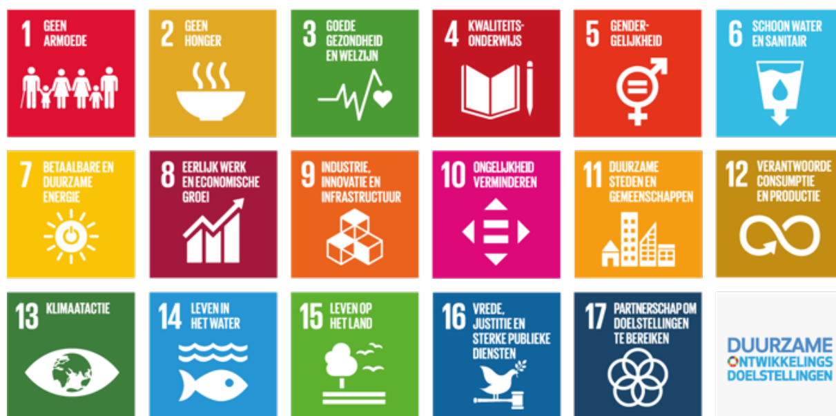
Overzicht van de 17 VN Sustainable Development Goals